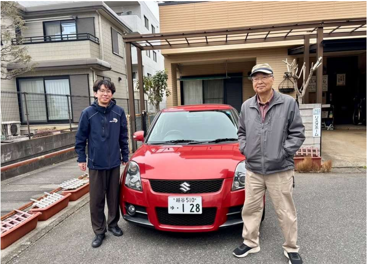
2/7 Life Support Organization Home 様より、クラブ活動の充実を目的にスイフトスポーツをご寄贈いただきました。