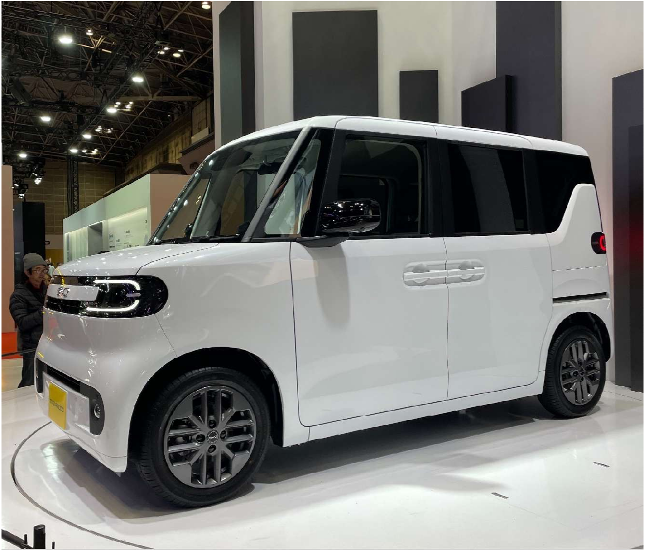
11/4 ジャパン モビリティ ショー（旧 東京モーターショー）を見学し環境配慮の自動車の先進技術を学習しました。写真は BYD の電気自動車