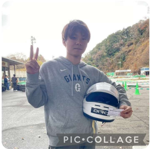
12/21 大井松田カートランドにて、12/29のAPG冬の陣大会に参加に向けて練習を行いました。クラブ員4名が自主的に練習に集まりました。