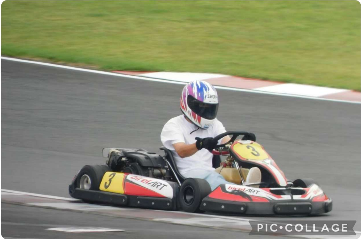
9/21 オートパラダイス御殿場にて、APG 冬の陣大会に参加を目標として現地にて初走行練習を行いました。