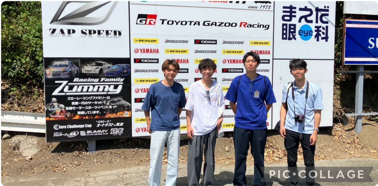
9/1 本格的なスポーツカート競技の活動を開始するために、カートコースの視察を行いました。 12月にオートパラダイス御殿場のAPG冬の陣大会（後述）に参戦する目標を立てました。