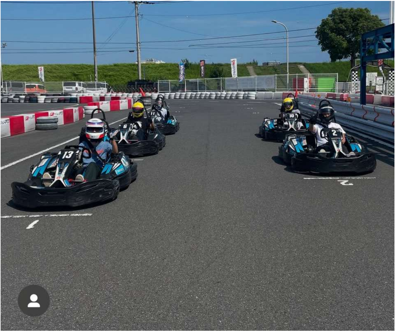
8/21 平塚市の F.ドリーム平塚にて初めての試みとしてカート活動に取り組みました。