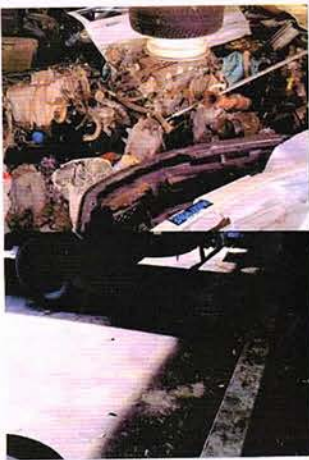
ため込んだ備品処分と下は整理後