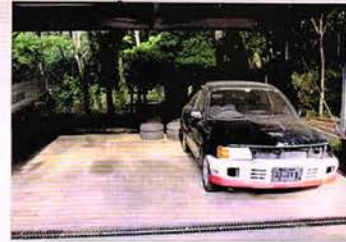
左と上の写真は2003年3月当時・久米さんが撮影した時の整理前と整理後です