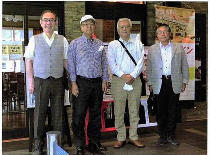
◎6月6日の世話人会時のメンバーです。