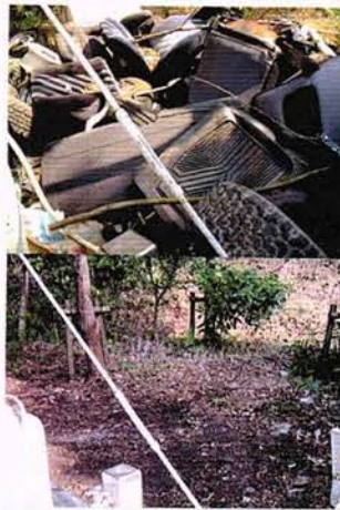
上はタイヤ等ゴミで下は整理した後