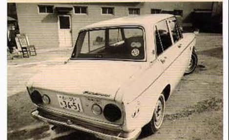
★ 昭和30年代の名車ですが？ 良く整備して動いたものと今でも感心させられます。特にポンテアックには驚かされたものです★