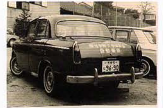
● 白金のテニスコート隣の車庫に名車が並ぶ整備場と数々の部車を集めました ●